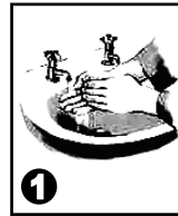
3 - غسل يدك جيداً