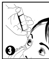
Instiller par pression sur la pompe à valve doseuse dans le cul de sac conjonctival inférieur de l'œil en regardant vers le haut et en tirant légèrement la paupière inférieure vers le bas