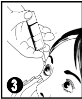
1 - قطر و ذلك بالضغط على مضخة الصمام القياسي داخل ردة الملتحمة السفلى للعين و ذلك بالنظر إلى أعلى و جذب الجفن السفلي قليلاً إلى الأسفل