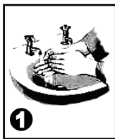
Se laver soigneusement les mains