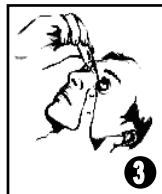
Retourner le flacon, appuyer légèrement au milieu et instiller dans le cul-de-sac conjonctival inférieur de l'œil en regardant vers le haut et en tirant légèrement la paupière inférieure vers le bas.