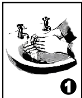
Se laver soigneusement les mains