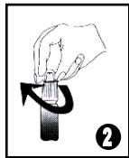
Visser le bouchon à fond pour percer