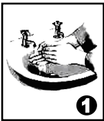
Se laver soigneusement les mains