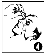
Retourner le flacon, appuyer légèrement au milieu et instiller dans le cul de sac conjonctival inférieur de l'œil en regardant vers le haut et en tirant légèrement la paupière inférieure vers le bas